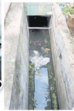
■溝渠內也有許多垃圾，未獲清理。