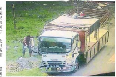
■在根登区，闭路电视也拍到有人驾驶罗厘丢弃沙石。

“我觉得这种方式相当被动，我会建议市议会进一步加强其服务，当该公司一旦发现闭路电视拍到有人非法丢弃垃圾时，就由该公司直接提供画面给市议会，而无需市议会再提供时间点给该公司查询之前所录下的片段，从中抽出有人丢弃垃圾的画面。”