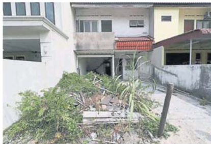
房子空置多时, 缺德人士却将垃圾丢弃该处, 以致引发各种卫生问题。

30 至 40 岁间, 平时也见到市政厅前来喷蚊雾, 相信本区骨痛热症高风险区内。”