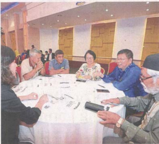
Stakeholders discussing what should be in MBPJ's 2020 budget.