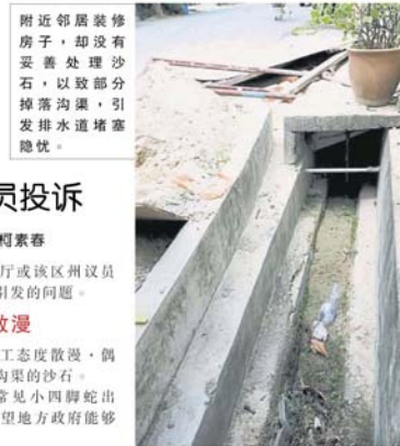
附近邻居装修房子, 却没有妥善处理沙石, 以致部分掉落沟渠, 引发排水道堵塞隐忧。

自该屋堆积物后, 隔壁邻居曾击了几次的蛇, 虽大家感到担心, 却不知如何解决呢?