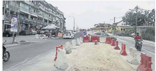
爱兰镇超级市场前的路口是否关闭，令人关注。

据《南洋商报》记者了解，道路加宽工程去年开始，分界堤 3 个月前才筑起，分界堤筑起后，爱兰镇住宅的 3 个出入口已无法从右转入。