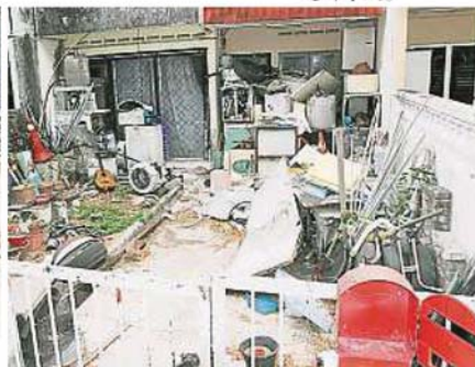
居民申诉其中一间民宅堆满杂物。