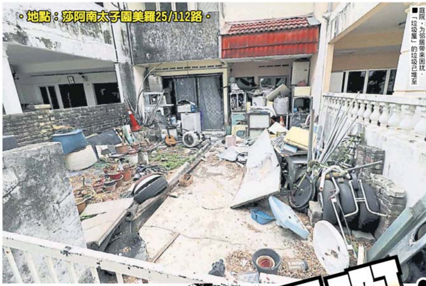
●地點：莎阿南太子園美羅25/112路●