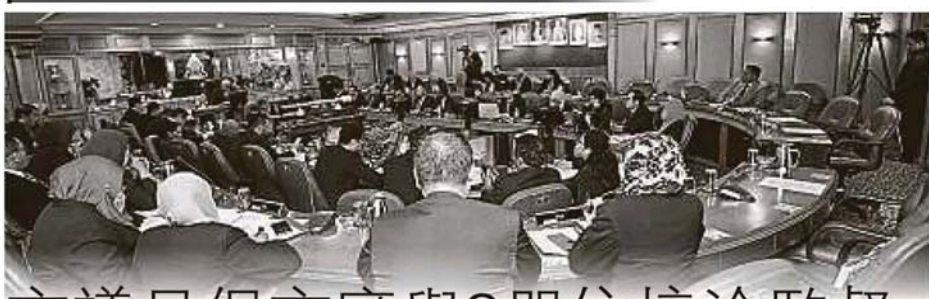
八打灵再也市政厅周三早上召开常月会议，讨论各项民生问题和决策。