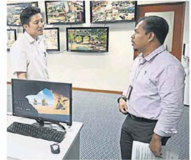
■士拉央市议会的闭路电视控制中心，总共监督74架城市安全的闭路电视，以及10架由市议会安装的监督非法丢弃垃圾的闭路电视。