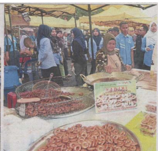
MPAJ is the first local council to implement the guidelines which have been in use at Pasar Malam Keramat Permai since March this year.