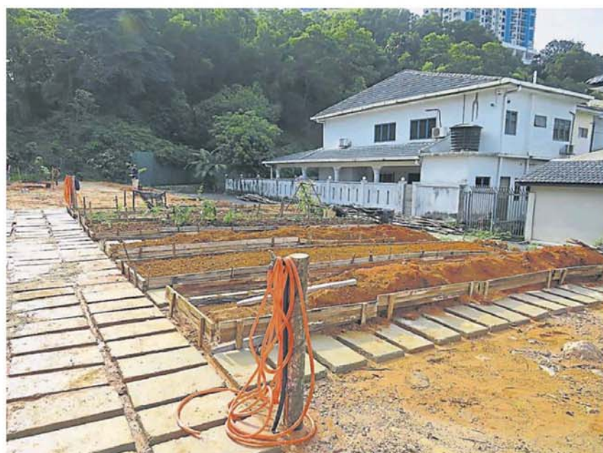
“都市农业”概念与市议会多年前推动的社区菜园概念一致。(档案照)

她继续说，目前确认有 20 个学校保留地段，会向教育部及州政府查询土地状况，以便取得同意及使用权，开放让居协申请；虽然不会征收租金，但申请使用有关地段的民间组织需遵守条件，例如照顾卫生、不能兴建建筑物等。