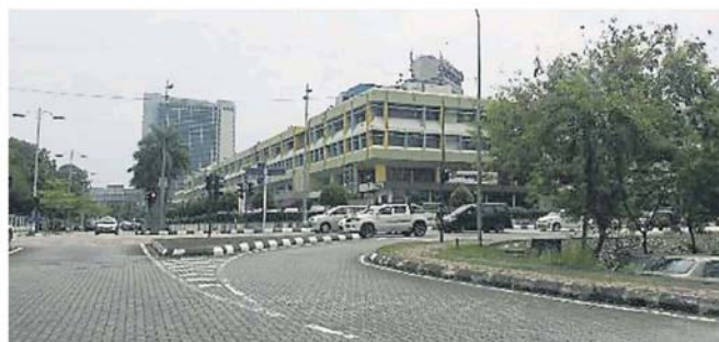
莎阿南欢庆升格为市 19 周年, 市政厅为市民提供多项优惠, 包括 10 月份内缴付多种罚单的市民, 一律可获 50% 的折扣。