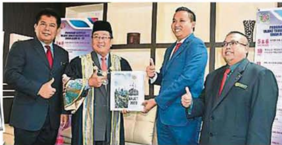
沙亞南市政廳2020年預算案，將遵循州政府的預算案收支平衡政策，為首次平衡預算案。