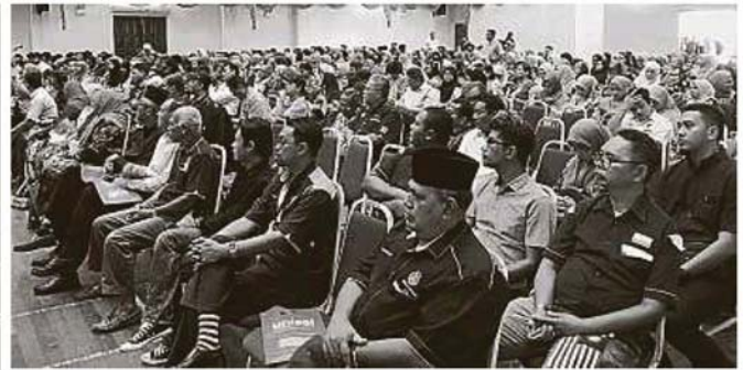
由雪兰莪大学主办的“和谐雪州论坛”获200名学生和非政府组织代表出席参与。