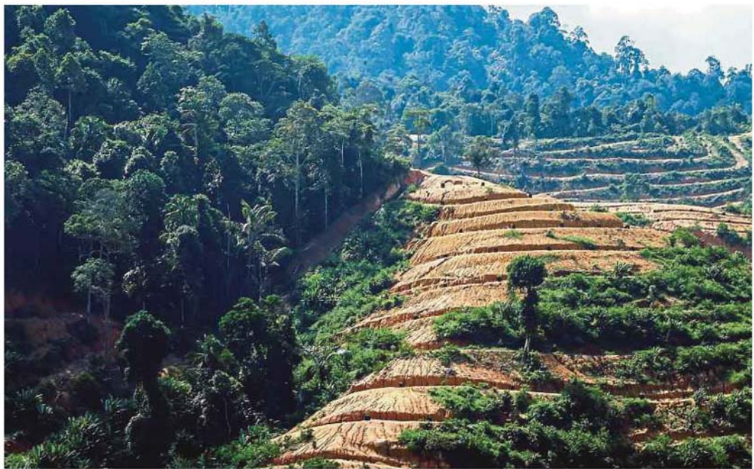
The annual allowable cut under the current 11th Malaysia Plan is 246,888ha.

Puat said the export and import of timber and its products last year were worth RM22.3 billion and RM5.25 billion, respectively.