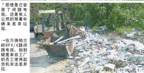
！即使是已安装了闭路电视，还是有人公然开着车辆来丢弃垃圾。