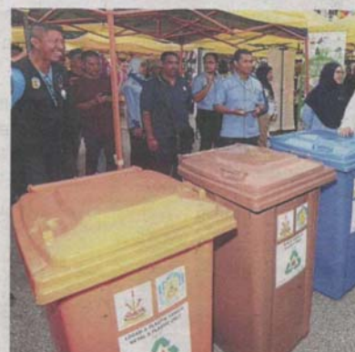
Waste management has been improved with the introduction of the new guidelines.

"Currently, there are different by-laws for different aspects with each local authority having its own rules," she said, adding the guidelines were important to ensure uniformity."