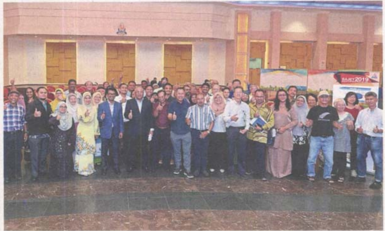
Sayuthi with representatives from residents association, Rukun Tetangga and NGOs at the town hall session.

court in Kampung Baru Subang, Section U6, constructing a high-rise market in Section 25 and a commercial complex in Section 17," he said at the council full board meeting.