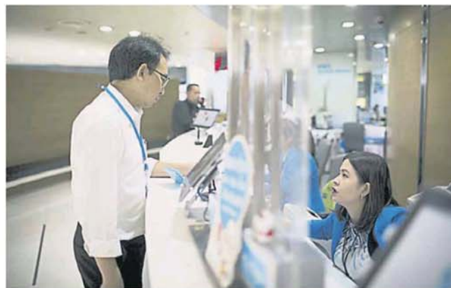
一些银行发出通告，使用银行柜台服务的人士需支付 2 令吉服务费。(档案照)

孙兴存说，该公会也希望政府在 2018 年财政预算案中宣布的 Step-Up 房屋贷款计划，能扩展至私人界的可负担房屋计划。他说，政府也可以考虑提供如 MyDeposit 的特殊融资计划，以协助首次购屋者，但只适用于 30 万令吉及以下的房屋。