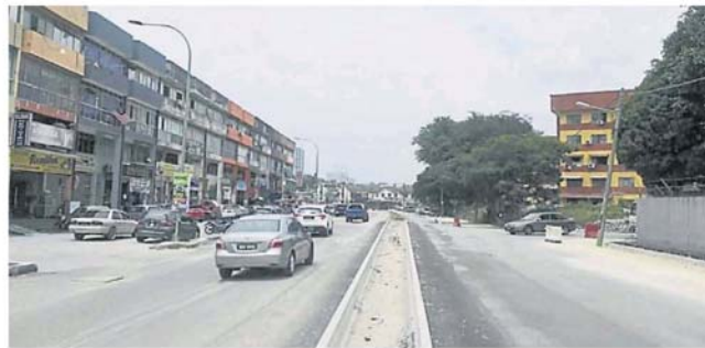
“一堤档路”，商民希望重开爱兰镇组屋和化粪池旁与商业区 15 路的路口。