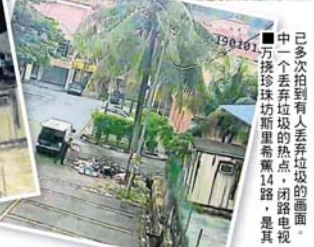
■中一个丢弃垃圾的热点，闭路电视万挠珍珠坊斯里希蕉14路，是其